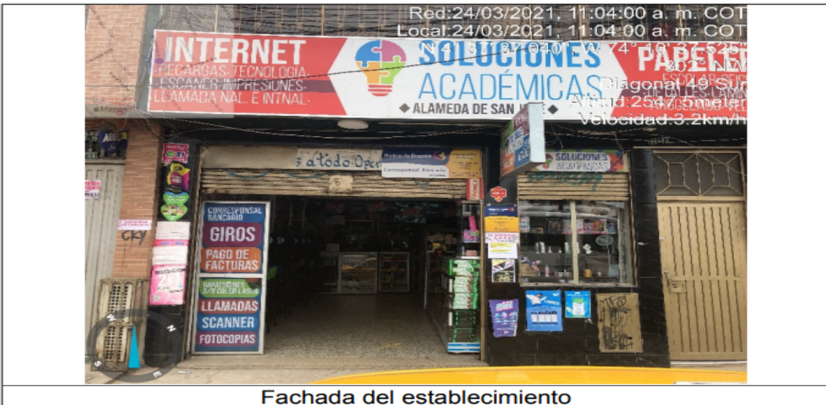
Fachada del establecimiento